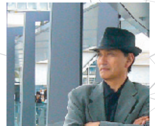
JR岐阜駅前再開発現場にて

「風土と伝統を活かして未来を創る」をテーマに、プロダクト、インテリア、パブリックデザイン、都市、自然環境にいたるまでのトータルデザインをめざして、我が国の景観やくらしのデザインの向上に取り組んでいる。